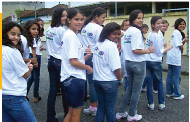
Guarujá, SP Escola Municipal Vereador Afonso Nunes: desfile representando os Programas Fura-Bolo e “de grão em grão”

Educadores e alunos das cidades de Ilhéus (BA), Porto Ferreira (SP) e Guarujá (SP) destacaram os Programas Fura-Bolo e “de grão em grão” , durante as comemorações da Independência do Brasil, em desfiles que marcaram o dia 7 de Setembro. Confira nas fotos alguns momentos.