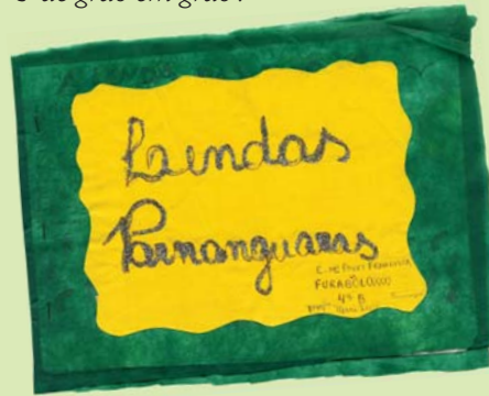
Alunos da Escola Municipal Professora Francisca produziram o livreto ilustrado Lendas Parnanguaras .

Com empenho e criatividade, educadores e alunos de Paranaguá (PR) ● realizaram trabalhos baseados nos Programas Fura-Bolo e “de grão em grão” .