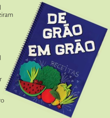
Alunos da Escola Municipal Professor Randolfo Arzua registraram desde o cultivo da cenoura na horta escolar até a preparação de pratos com o legumes e outros produtos cultivados, no livro “de grão em grão” receitas.