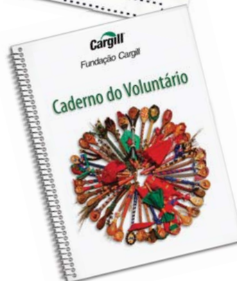
Caderno do Voluntário: orientações básicas sobre voluntariado e programas da Fundação Cargill

quais atuam. Além do Caderno do Voluntário , que traz informações e orientações gerais sobre voluntariado e programas da Fundação Cargill, toda a equipe deve consultar a Apostila do Voluntário . Nela estão reunidas diversas sugestões de atividades, criadas de acordo com os princípios e objetivos dos Programas Fura-Bolo e “de grão em grão” .