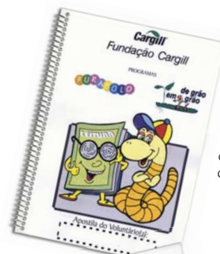
Apostila do Voluntário: sugestões de atividades diversificadas

Para a brincadeira educativa, os voluntários elaboram um total de 80 questões, sendo 20 para cada série e dez de cada programa. A atividade atrai os alunos e aqueles que