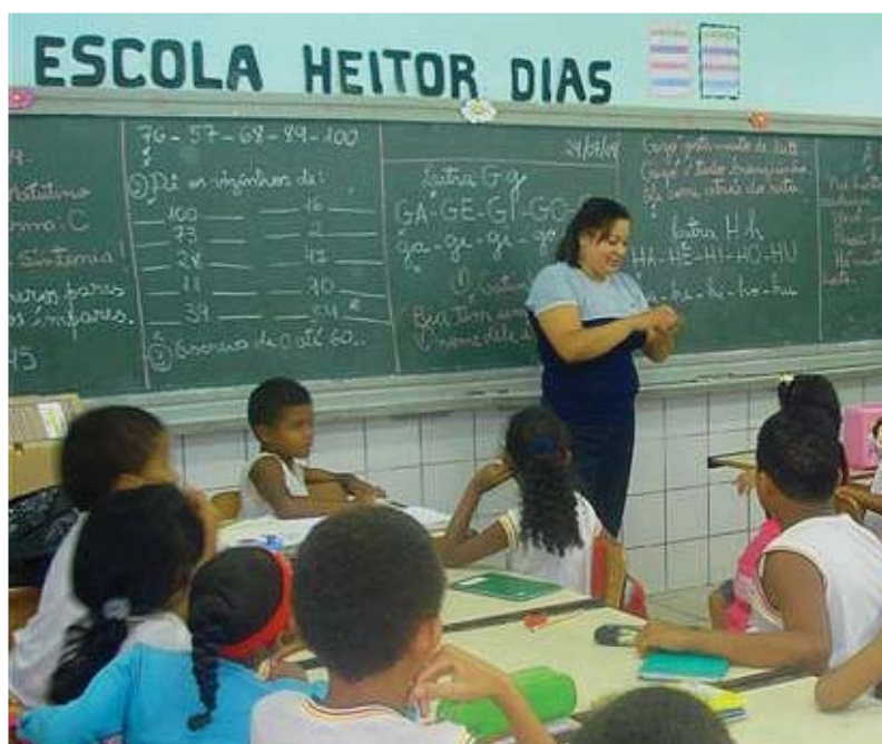
Voluntária faz jogo de perguntas com alunos da Escola Municipal Heitor Dias, em Ilhéus (BA)

Todos os voluntários da Cargill contam com ferramentas de apoio oferecidas pela Fundação Cargill, para a realização de diferentes atividades nas escolas nas