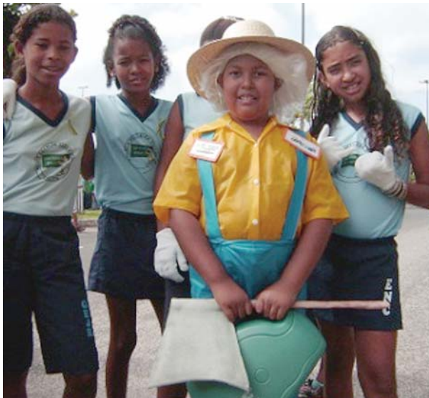
Ilhéus, BA Grupo Escolar Jabes Ribeiro: desfile representando o Programa “de grão em grão”