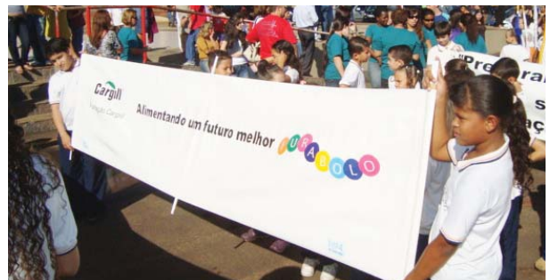
Porto Ferreira, SP Escola Municipal Noraide Mariano: desfile representando o Programa Fura-Bolo

Educadores e alunos das cidades de Ilhéus (BA), Porto Ferreira (SP) e Guarujá (SP) destacaram os Programas Fura-Bolo e “de grão em grão” , durante as comemorações da Independência do Brasil, em desfiles que marcaram o dia 7 de Setembro. Confira nas fotos alguns momentos.