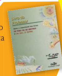
Proposta de atividades para professores

• O Jornal Fura-Bolo ganha os prêmios nacional e regional da ABERJ - Associação Brasileira de Comunicação Empresarial, na categoria Boletim Externo .